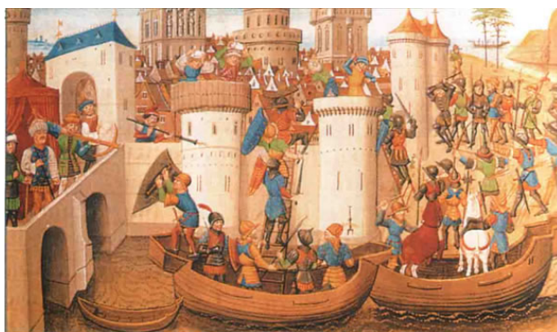
Взятие Константинополя в 1453 году турками из французской хроники (1462 года)

С рассветом 29 мая 1453 г. мои войска двинулись на приступ и с моря, и с сухого пути. Мы двигались плотно сомкнутыми рядами. Много моих воинов полегло в то утро. Ни одна стрела и ни одно пушечное ядро не были потрачены христианами напрасно. Передние ряды моих солдат, состоящие из всякого сброда, были обречены. Они поднимались на городские стены, и их сбрасывали в ров, который весьма скоро наполнился трупами, по